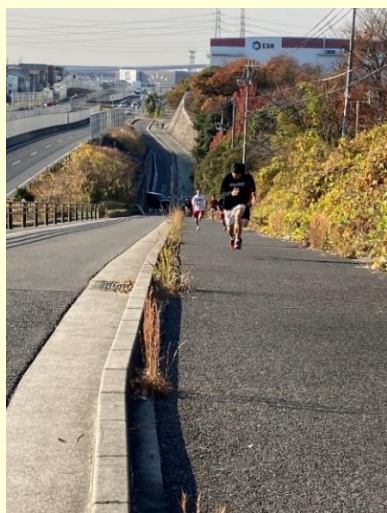
しっかり走り込みました

今年は恒例の夏季合宿が実施できなかったため 12 月に短期の冬季合宿を行いました。