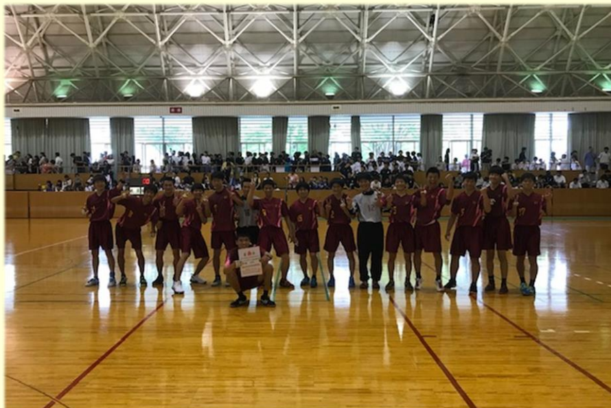
県総体表彰式を終えて