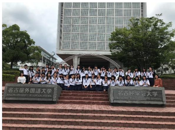
名古屋外国語大学・名古屋学芸大学