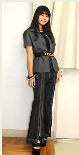
1年 シャツブラウス