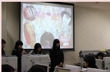
プレゼンテーション