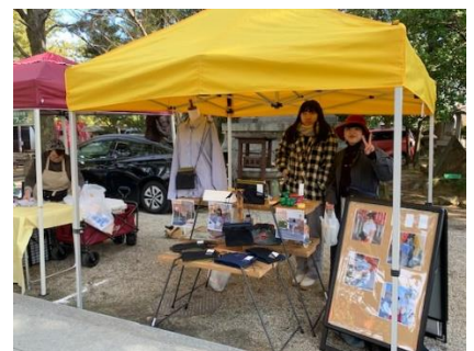
《マルシェ等での商品販売》