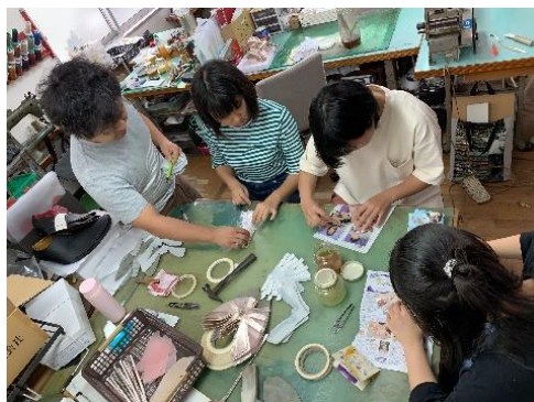
くつ・クラフトスクール